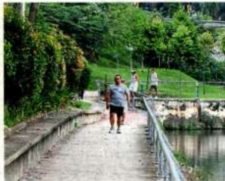
Those jogging and cycling in public parks are reminded to keep a safe distance. This photo was taken early last month, before the announcement of park closures.

"I have not seen temperature being taken or even the use of the app (for contact tracing) at these parks.