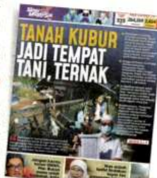
Laporan Sinar Harian pada Isnin.

Sinar Harian pada Sabtu melaporkan mengenai Pusat Jagaan Al Fikrah Malaysia yang mengharapkan pertimbangan JAIS untuk memberi kebenaran meneruskan aktiviti tanaman dan ternakan di atas Tanah