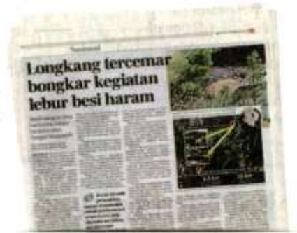
Keratan akhbar BH, semalam.

Norlin berkata, setakat ini, limpahan daripada kolam takungan tidak memberi kesan kepada Sungai Semenyih yang terletak kira-kira 2.3 kilometer dari tapak premis dan Loji Rawatan Air